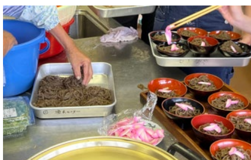
・対馬グローバル大学イベント