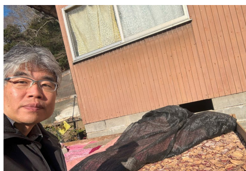
・せんだんごサンプリング